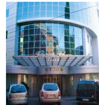
Hotel Triumph Palace